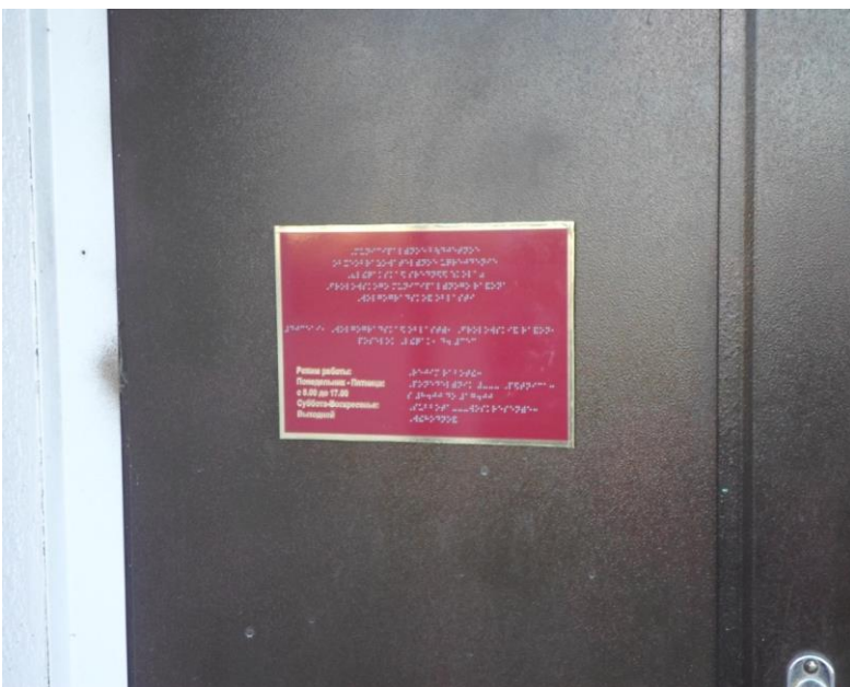
6. Указатели на пластиковой основе